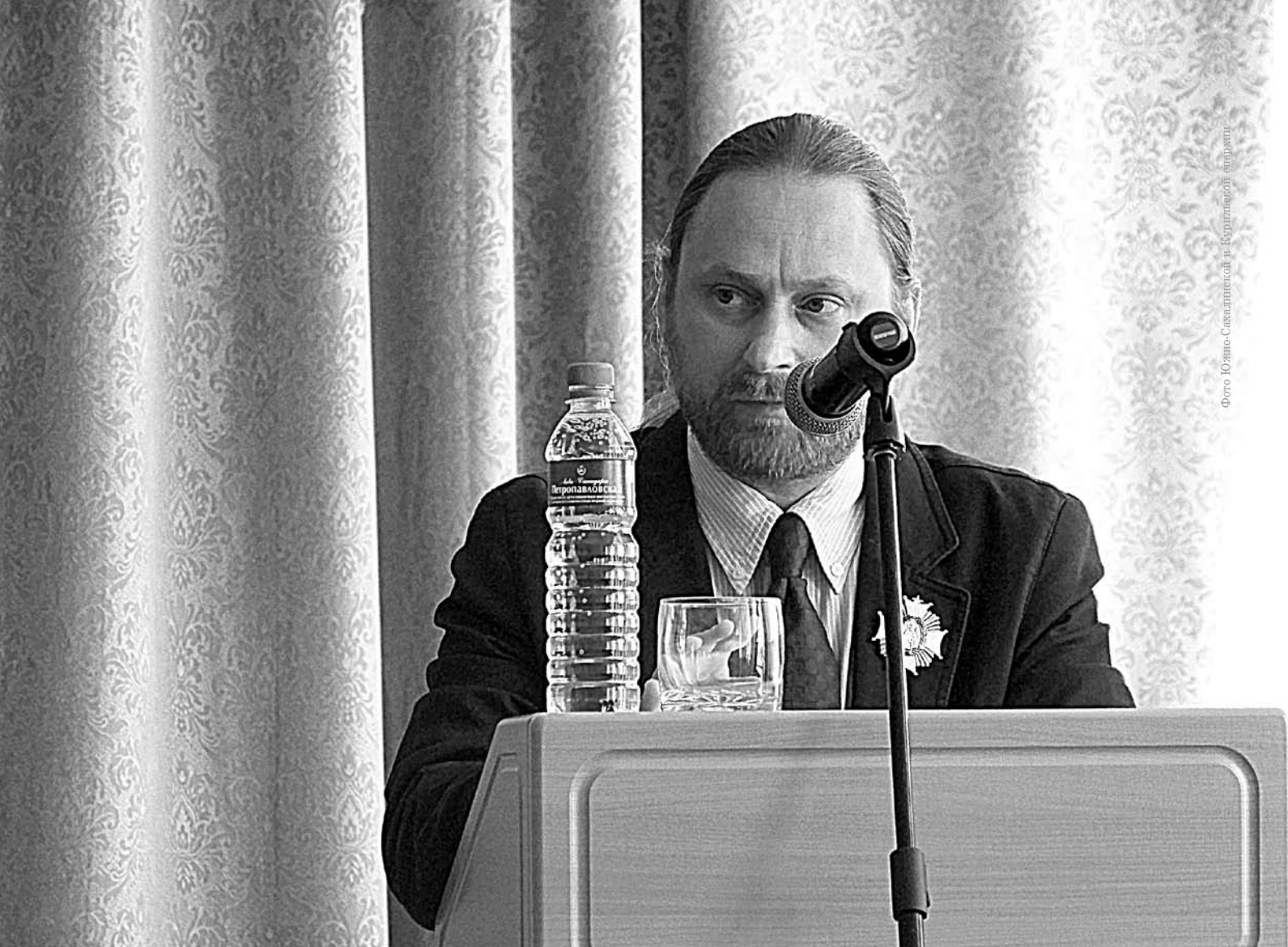
Фото Юлиан-Савваитовской и Курляндской епархии