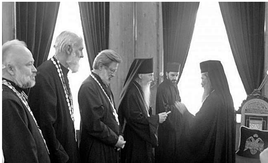
Святая земля. На приеме у патриарха Феофила III

Конечно, и власти со всех сторон нас тоже прижимают. Стараются все время отсечь кусок земли. Приходится строить стены за невероятные деньги. Сейчас с израильскими властями у нас более-менее спокойные отношения, но надолго ли это? Однако мы обязаны выстоять, ведь в настоящий момент на Святой земле по официальным данным двести пятьдесят тысяч православных русскоязычных. На самом деле их намного больше, вероятно вдвое больше. Но в наши храмы приезжают считанные единицы. В основном в субботу, так как это выходной день. Причем приходят с опаской: боятся, что их заметят. Да, ситуация сейчас легче, чем была, скажем, двадцать лет назад. Тогда нас не защищал никто и нигде. Я своими глазами видел, как прямо в аэропорту в Тель-Авиве евреи оплевали священника и долго издевались над ним.