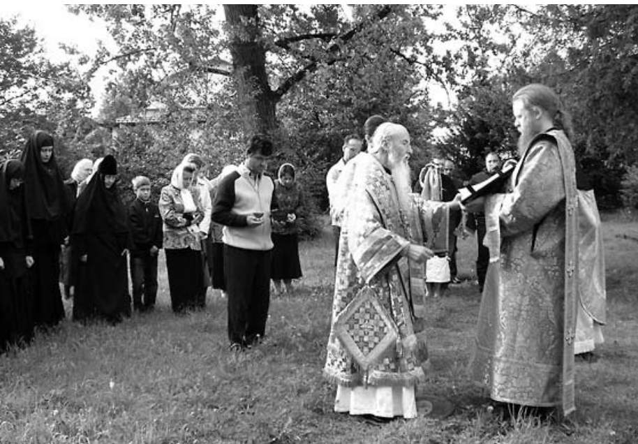
Молебен в Мюнхене

Богослужение в Германии иногда совершается на немецком языке. При этом преимущественно мы используем все-таки церковно-славянский язык. Но есть разные подходы к этому вопросу, в зависимости от способностей священника, от потребностей прихода. Во многих приходах читают Евангелие и Апостол, возглашают одну-две ектении на двух языках, а что-то – по-немецки. Есть приходы, где службы совершаются по большей части на немецком, но с некоторыми вставками по-славянски. Где-то раз в месяц служат только по-немецки. Есть приходы, где немецкий язык звучит по субботам, чтобы от храма не отпали люди, которые имеют возможность ходить туда только раз в неделю и не понимают церковно-славянского языка. То есть мы поощряем самые разные подходы, потому что понимаем: мы должны рассчитывать на то, что через десять-пятнадцать лет те люди, которые сейчас наполняют наши храмы, а также их дети, уже не будут владеть рус-